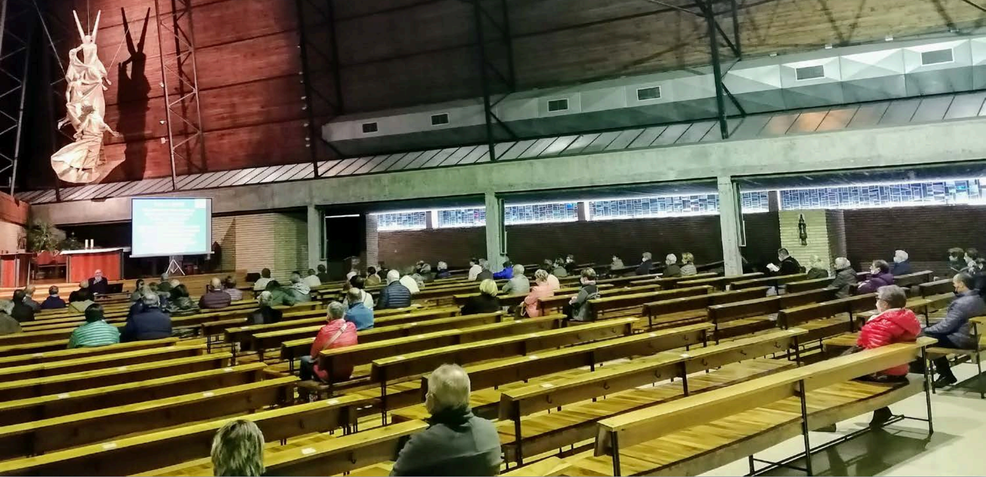
Fray Mitxel expone el capítulo I de la encíclica Fratelli Tutti "Las sombras de un mundo cerrado" 29/10/2020